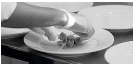
Skåvsjöholm AB i Åkersberga har under året haft en ökning i såväl beläggning som snittintäkt per gäst.

det helägda dotterbolaget Skåvsjöviken Fastighets AB. Under 2012 avyttrades bolaget till NCC.