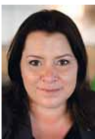
Carin Wallenthin, pressombudsman, adjungerad